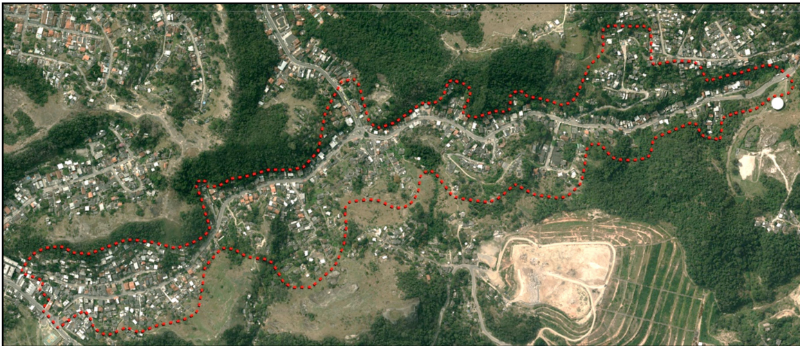
Figura 4 : Poligonal de intervenção do PRODUIS na comunidade São José, fronteira entre os bairros Fonseca, Viçoso Jardim e Caramujo.