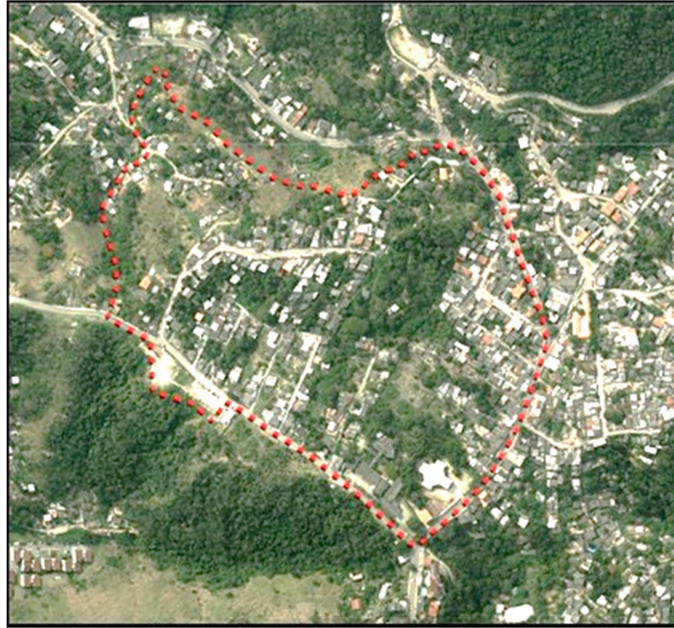
Figura 2 : Poligonal de intervenção do PRODUIS na comunidade Capim Melado, fronteira entre os bairros Viçoso Jardim e Ititioca.