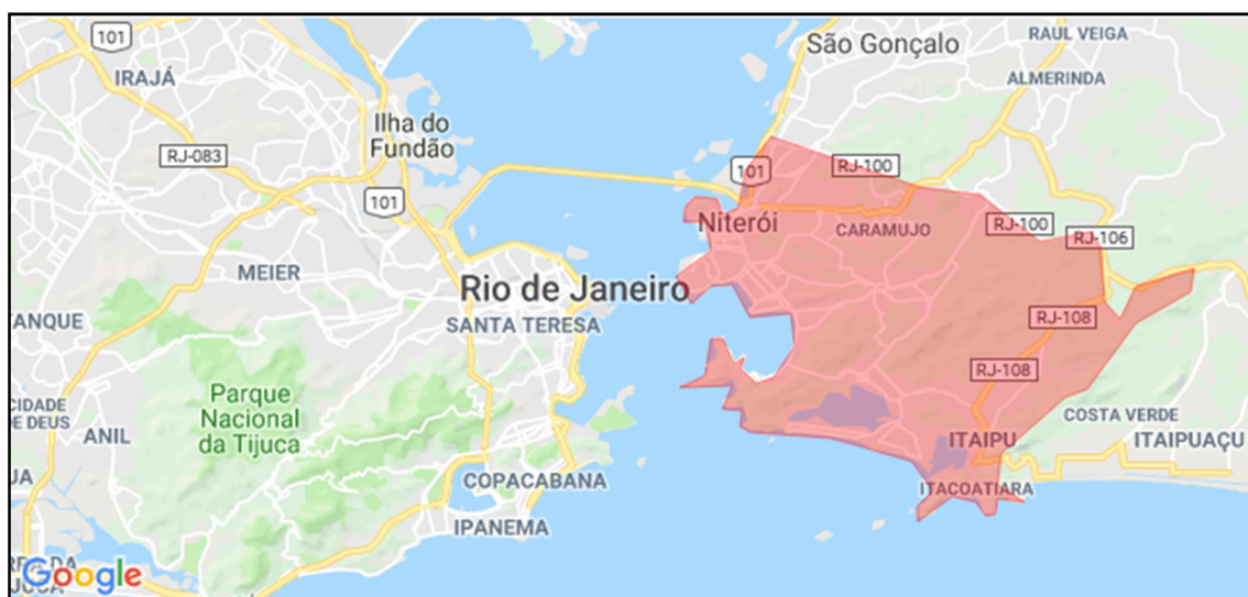
Figura 1: Localização do município de Niterói (delimitação em vermelho), RJ.

O item (iii) contemplou a implantação de um CTM atualizado e a sistematização de novas bases de imagens e a compilação, reestruturação e incorporação das bases de dados existentes da Secretaria Municipal de Urbanismo e Mobilidade (SMU), da Secretaria Municipal de Fazenda (SMF) e da Secretaria de Meio Ambiente, Recursos Hídricos e Sustentabilidade (SMARHS), com foco na atualização do cadastro e na sistematização dos registros Municipais relacionados com as áreas comerciais e residenciais, cadastro do IPTU, meio ambiente e áreas de risco.