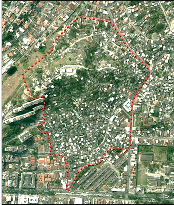
Figura 3 : Poligonal de intervenção do PRODUIS na comunidade Vila Ipiranga, bairro Fonseca.